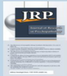
Journal of Research in Psychopathology