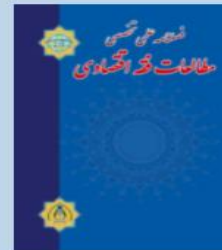
مطالعات فقه اقتصادی