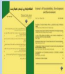
بایداری، توسعه و محیط زیست