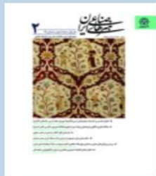
هنرهای صنعتی ایران