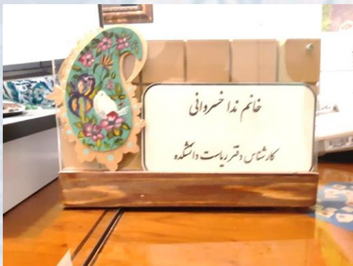
طراحی و ساخت استند معرفی همکاران دانشکده