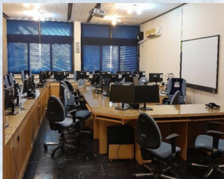
مرکز چند رسانه ای