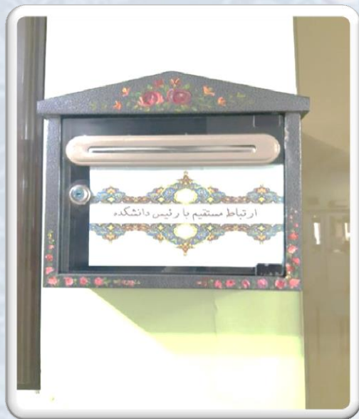
نصب صندوق پیشنهادات و انتقادات برای ارتباط مستقیم با رئیس دانشکده ادبیات