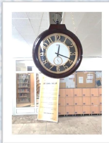
نصب ساعت روبه روی در ورودی دانشکده ادبیات به منظور تنظیم وقت استادان و دانشجویان