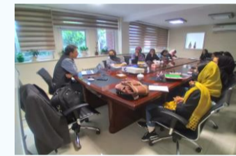
برگزاری دوره ها و کارگاهها